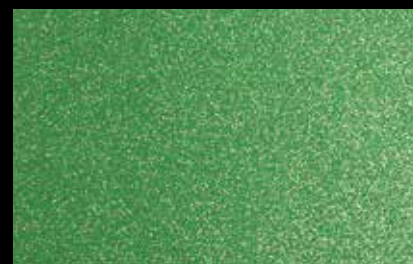
0961 Apple Green