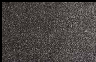
0910 Black with silver glitters