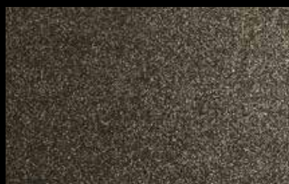
1910 Black with gold glitters