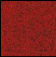
1632 Ruby Red