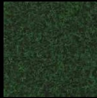
1531 Amazonia Green