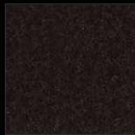
1040 Pure Solid Black