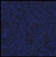
1624 Cobalt Blue