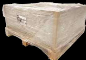
Palette 100 dalles avec coins renforcés Pallet 100 tiles with reinforced corners