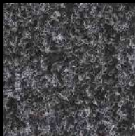
1005 Dark Grey