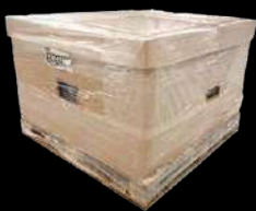
Kit carton 100 dalles Cardboard kit 100 tiles

References in bold are held in stock. Other references on order. Special colours on order. Mini 5 000 m 2 . For more information, please contact our sales team.