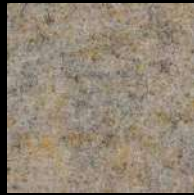
1516 Gobi Beige