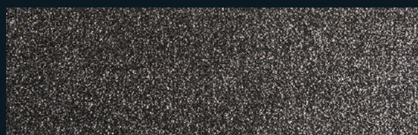
0910 Black with silver glitters