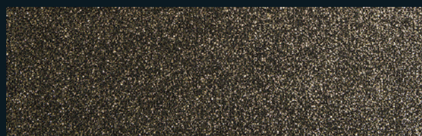
1910 Black with gold glitters